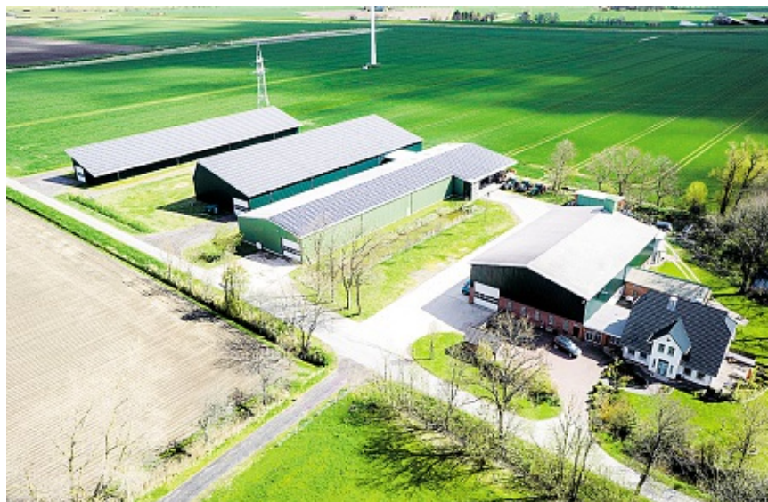
Jan Henning Ufen will den integrierten Pflanzenschutz auf seinen Schlägen möglichst konsequent betreiben, und die Teilnahme an dem Modell- und Demonstrationsvorhaben ist eine logische Konsequenz.

Ein Standbein des Betriebes ist der Weißkohlanbau. Auf den meist nährstoffreichen Marschböden mit ausreichenden Niederschlägen im Jahr finden sich ideale Anbaubedingungen für Kopfkohl. Auf der Betriebsfläche von insgesamt knapp 100 ha werden neben Weizen und Knollensellerie zirka 10 ha Weißkohl für die Lagerung angebaut. Die Vermarktung